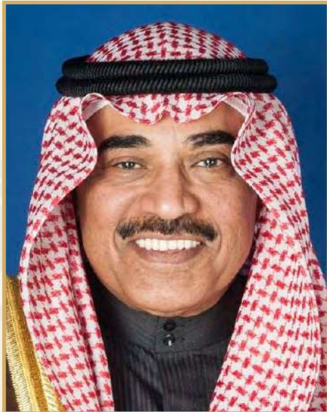
H.H. Sheikh Sabah Al-Khaled Al-Hamad Al-Sabah The Prime Minister of the State of Kuwait