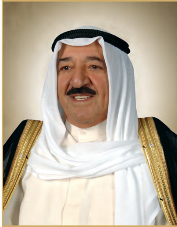
H.H. Sheikh Sabah Al-Ahmad Al-Jaber Al-Sabah The Amir of the State of Kuwait