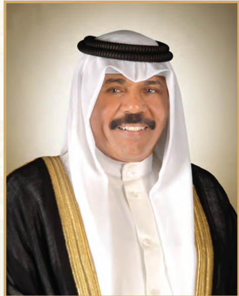
H.H. Sheikh Nawad Al-Ahmed Al-Jaber Al-Sabah The Crown Prince of the State of Kuwait